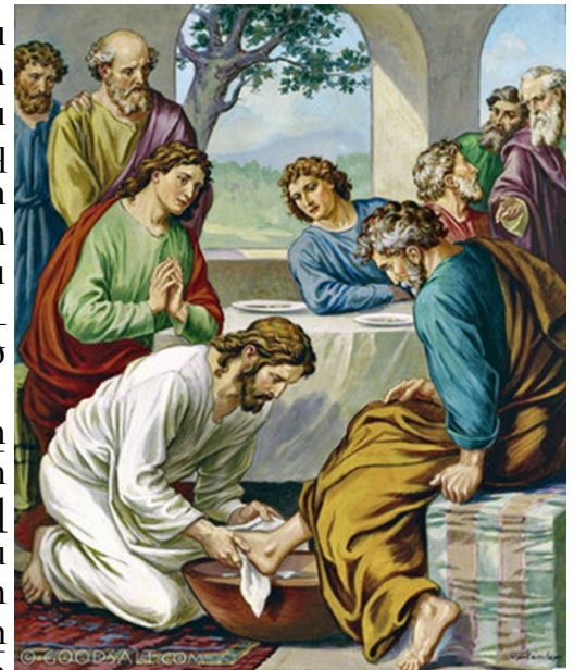
WASHING OF THE FEET

St Yeghiche Armenian Church Parish Council.